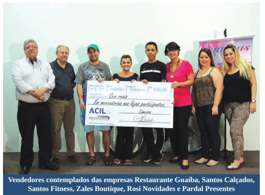
Vendedores contemplados das empresas Restaurante Guaíba, Santos Calçados, Santos Fitness, Zales Boutique, Rosi Novidades e Parda Presentes