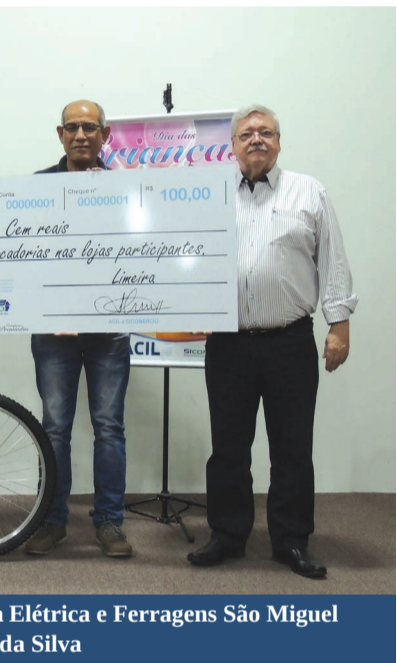
Elétrica e Ferragens São Miguel da Silva